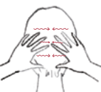
3. 後頭部をマッサージ

指の腹で地肌をつかみ、頭皮に円を描くように揉み込み、頭頂部へ向かってマッサージをしてください。