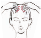
2. 前頭部をマッサージ

頭皮から塗布してください。頭皮にしっかり揉み込ませるようにつけ、手に残ったコンディショナーを髪全体、毛先までまんべんなく行き渡らせませす。